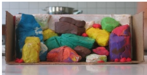
Modell aus Knetmasse 1:10

Dadurch erhielt ich einen ersten Eindruck der Steinformation und konnte auf einfachste Weise Änderungen an der Zusammenstellung vornehmen. Mittels Digitalkamera hielt ich verschiedene Ideen fest.