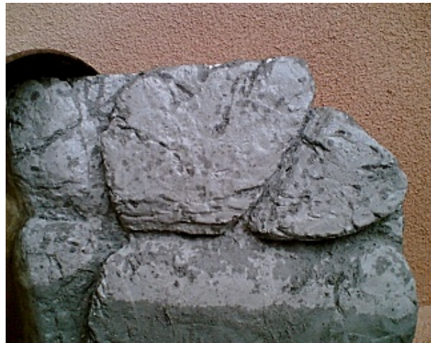
Ausschnitt Rückwand mit deutlich sichtbarer Struktur

Abschliessend lässt man den künstlichen Stein einen, besser zwei Tage lang aushärten. Danach kann man Styropor, Plastikfolie und Nägel entfernen. Eingemauerte Nägel habe ich mit etwas hin- und herbewegen recht gut rausbekommen.