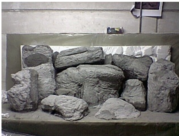
Beinahe fertige Steine vor Styroporrückwand