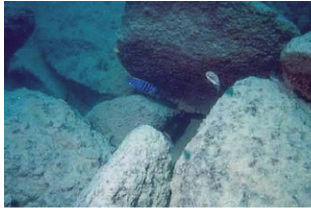
Unterwasseraufnahme Lake Malawi

Die technische Anforderung an die Rückwand war, den Eingang- und die zwei Ausgangsrohre meines Eheim Pro III plus den Jäger Regelheizer (umströmt) aufzunehmen.