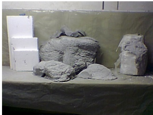
Steine in verschiedenen Stadien

Zuerst wählte ich mal einen kleineren Stein meines Knetmodells aus und baute ihn mit Styropor in groben Zügen 9x grösser nach. Nicht 10x, weil nachher noch Mörtel drauf sollte. Das Hochrechnen war einfach, da mein Modell ja genau den Massstab 1:10 hatte. Um Dicken von mehr als 5 cm zu erreichen, steckte ich mehrere Platten mittels der Nägel zusammen. Ebenfalls mit einer Hand voll Nägeln fixierte ich die Plastikfolie, mit der ich den Klotz überzogen hatte. Das Putzgitter legte ich schliesslich in vielen dünnen Streifen darüber, welche ich mit ein paar wenigen Nägeln rutschsicher machte.