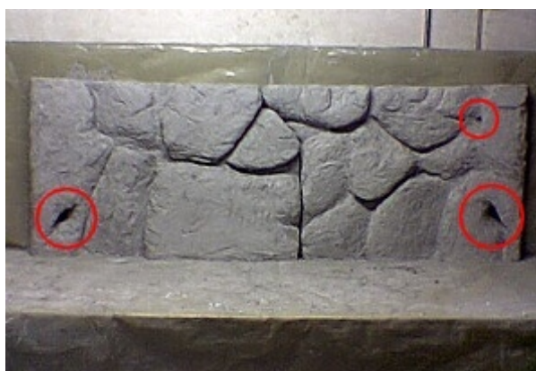
Fertige zweiteilige Rückwand mit Wasserkanälen (rot)

Nach dem der Mörtel trocken war, schnitt ich hinten die Aussparungen für die Rohre und den Heizer heraus. Zudem schnitt ich weitere Vertiefungen in den Styropor, um ein Schwimmen der Rückwand zu verhindern. Natürlich versuchte ich dabei, die Bruchfestigkeit nicht zu gefährden.