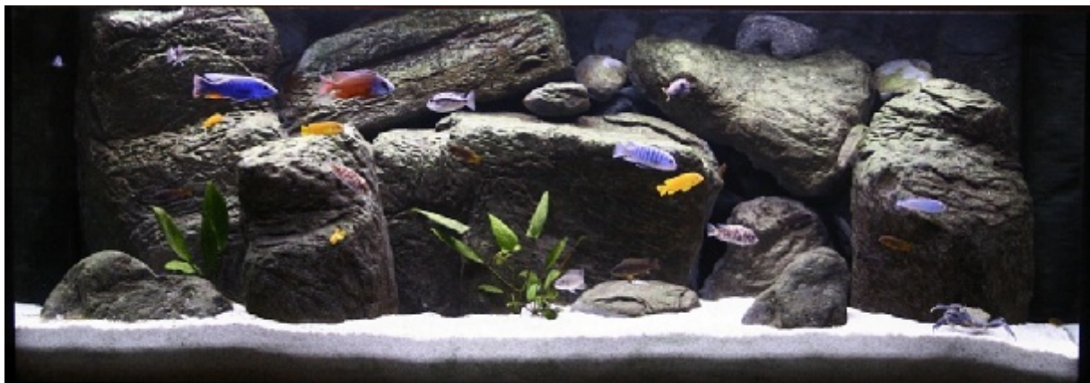
Das Becken heute